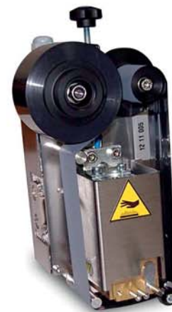
Marcatore termico Thermal ink marker Marcador termico de tinta